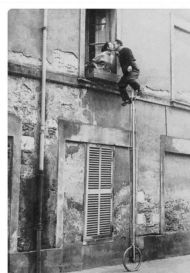
Romeo and Juliet?