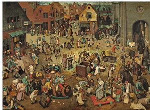
Peter Bruegel l'Ancien, 1559