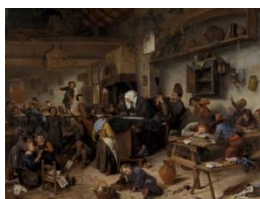
Jan Steen, "A School for Boys and Girls"

Programme D Le sujet comme objet, Thème D2 « Nouvelles frontières du récit de soi »